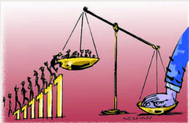
Dessin : Jean-Louis Lejeune.

C'est pourquoi nous appuyons et renforçons des acteurs sociaux organisés, porteurs de changement social, avec lesquels nous agissons en alliance en vue d'exercer une influence sur les politiques nationales et internationales qui régissent les rapports sociaux, culturels et économiques.